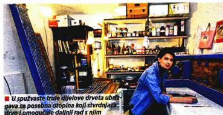
■ U spužvaste trule dijelove drveta ubrizgava se posebna otopina koji stvrdnjava drvo i omogućuje daljnji rad s njim