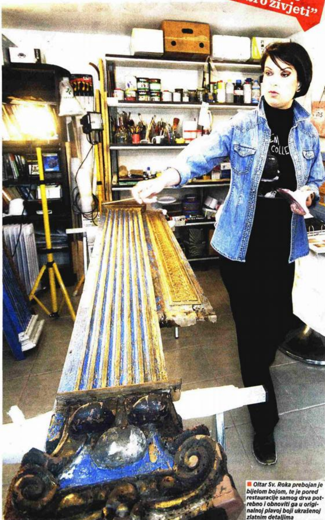
■ Oltar Sv. Roka prebojan je bijelom bojom, te je pored restauracije samog drva potrebno i obnoviti ga u originalnoj plavoj boji ukrašenoj zlatnim detaljima

služi za čišćenje, jednako kao i za stvaranje podloge za nanos pozlate, te posebno otrovni Shellsol T i kancerogeni Toluene koji se za čišćenje i otapanje ne smiju koristiti bez zaštitne maske. Pored opasnih tvari koriste se i neka otkrića iz područja kozmetike poput pelmulena, a od organskih materijala ističu se kistovi od vjeveričjeg repa koji služe za nanos srebrnih i zlatnih listića, slonova kost koja služi pri poliranju zlata te tutkalo koje se izrađuje od hrskavice iz zečjih ušiju, a koristi se za dopunu i izradu preparacijske podloge. Najveća oštećenja drvenih dijelova izrađuju se u potpunosti iznova od drveta lipe koje se odlikuje svojom mekoćom.