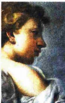
Prije i poslije restauracije – detalj trsatske slike