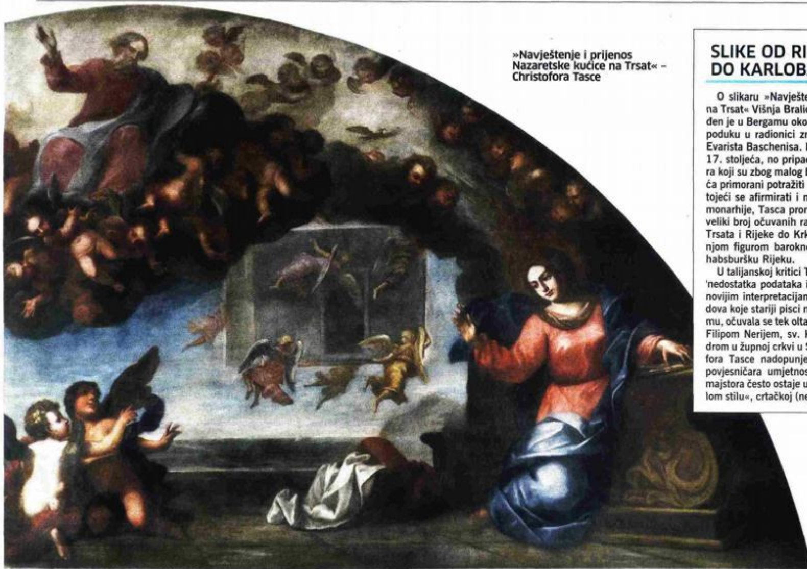
»Navještenje i prijenos Nazaretske kućice na Trsat« - Christofora Tascce