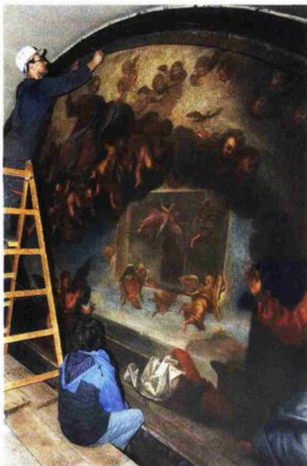
Slika se vratila

Tascin angažman na Trsat započinje narudžbom sli-