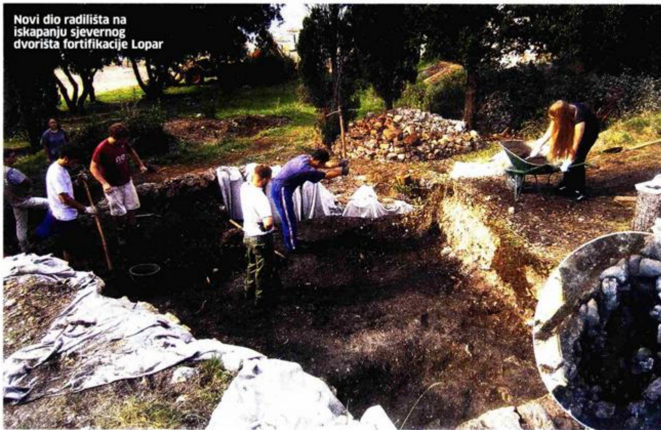
Novi dio radilišta na iskopanju sjevernog dvorišta fortifikacije Lopar