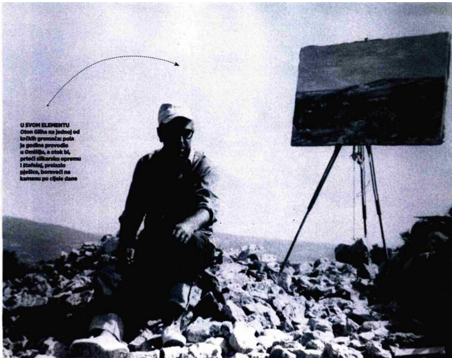
U SVOM ELEMENTU Oton Gliha na jednoj od krčkih gromača: pola je godine proveo u Omilju, a otok bi, prteći slikarsku opremu i štafela, prolazio pješčica, boraveći na kamenu po cijele dane

» hrvatskih slikara i kipara koji su sudjelovao na 31. i 32. Biennalu u Veneciji 1962. i 1964. godine, gdje je imao zapažen nastup. Kriza umjetnosti koja se počela javljati sredinom desetljeća neće ga "poremetiti" upravo zbog drugačije utemeljenosti njegova likovnog izraza. Njegovom i Džamonjinom izložbom, uz Dürerove grafike, bili su otvoreni današnji Klovićevi dvori. Zastupljen je i u brojnim drugim važnim svjetskim zbirka – u torinskoj Modernoj galeriji Glihine Gromače vise pored Antonia Tàpiesa, a i općenito je Gliha bio vrlo poznat i u Italiji.