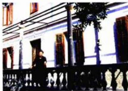
03 Gligin autoportret: iako većinu opusa čine pejzaži, ostavio je i nekoliko vrhunskih portreta, uglavnom prijatelja