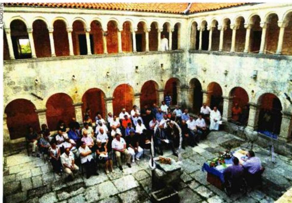
Pavlinski klaustar u Svetom Petru u Šumi

Taj se kaštel obnavlja od 2010. godine, a za sada je u njegovu obnovu uloženo 3,5