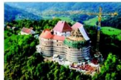
Pogled na obnovu kompleksa u proteklom razdoblju koju je vodio Hrvatski restauratorski zavod

Ulaz u dvorac oduvijek je bio na istome mjestu, samo što je tijekom vremena upravo taj ulazni dio dvorca najviše dograđivan i mijenjan. Na kat se ulazi s južne strane,