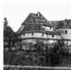
Pogled na dvorac Veliki Tabor prije obnove