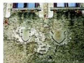
Detalj zida s grbovima plemeniša – vlasnika

iz druge polovice 15. stoljeća. Premda je kao srednjovjekovna utvrda prenamjenjivan u dvorac u 17. i 18. stoljeću, očuvao je kasnogotičke oblike i arhitektonsku kompoziciju.