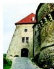
Pogled na ulaz u kompleks dvorca