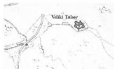
Katastarska karta iz 1861. godine