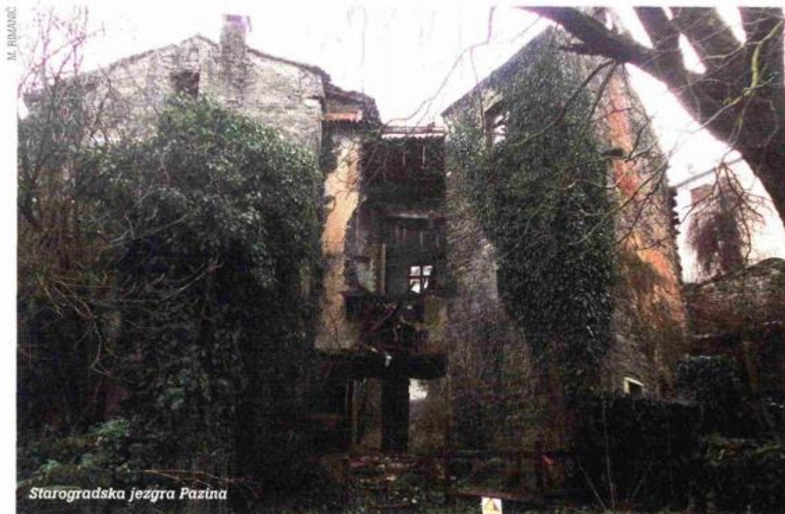
Starogradska jezgra Pazina

Danas prepoznatljivi arhitektonski elementi nastali su većim dijelom tijekom 16. stoljeća, no detaljnije analize zasigurno bi otkrile i starije strukture s obzirom na raniji nastanak bedema suburbija. Jedna od najbolje sačuvanih povijesnih urbanih mikrolokacija obilježenih kasnogotičkim i renesansnim stilskim karakteristikama grada Pazina i središnje Istre, koja je pri tome smještena neposredno uz najznačajniju istarsku srednjovjekovnu feudalnu utvrdu, u posljednjih je dva desetljeća dobrim dijelom svedena na ruševne ostatke. Slijedom navedenog, Ministarstvu je prijavljen program preventivne sanacije lokaliteta, čime je osiguran dio sredstava za početak provođenja programa etapne sanacije. Tako će prva faza obuhvatiti izradu dokumentacije postojećeg stanja i preventivne zaštitne radove, dok se u sljedećem provedbenom razdoblju planira izrada tehničke dokumentacije