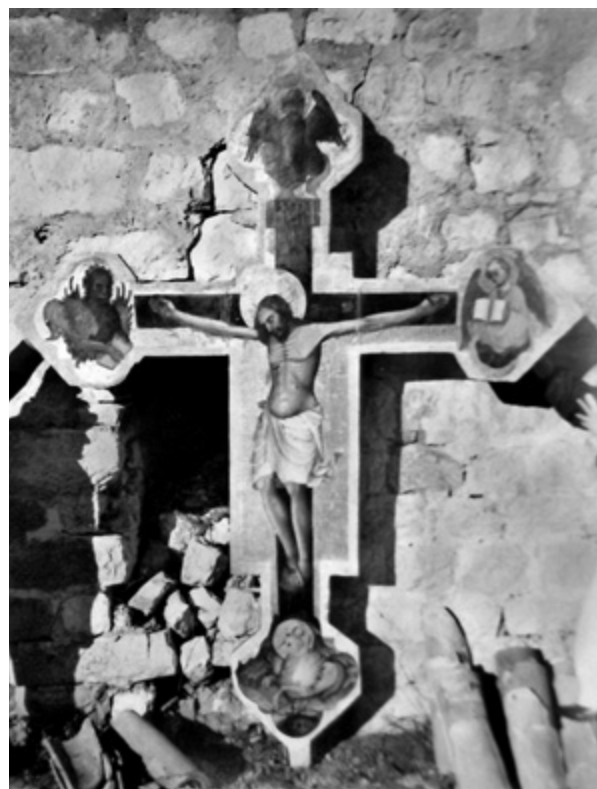
9. Raspelo snimljeno 1962. godine Crucifix photographed in 1962