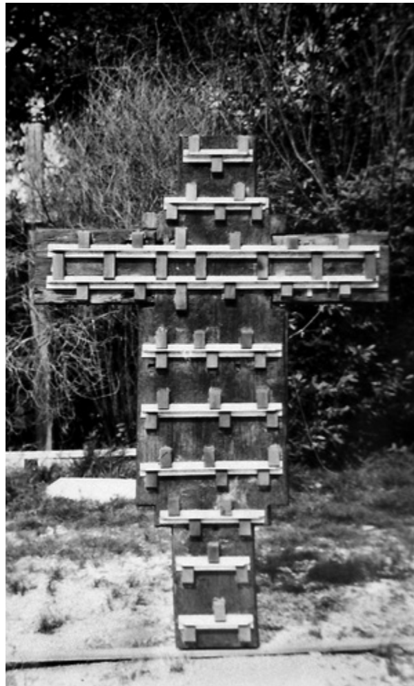
16. Raspelo snimljeno s poledine nakon zahvata Back of the crucifix, after conservation

Iako se djelatnost Cvite Fiskovića u zaštiti i restauriranju povijesnog slikarstva i skulpture na obali treba analizirati uzimajući u obzir kontekst vremena u kojem je djelovao, njegova se ideja o suradnji restauratora i povjesničara umjetnosti pokazala kao suvremen i vrlo primjenjiv alat u zaštiti povijesnog slikarstva i skulpture. Naime, uvažavanjem uloge restauratora koji su poznavali materijalnost umjetnina, prikupljene su različite informacije koje su znatno pridonijele povijesti umjetnosti. Uključivanje stručnjaka različite naobrazbe osnažilo je projekte splitske restauratorske radionice i omogućilo autoritativnije zaključke na polju povijesti umjetnosti. Istraživanje je nedvojbeno