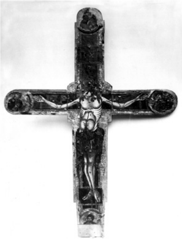
5. Raspelo poslije zahvata 1959. godine Crucifix after the 1959 conservation

istaknuvši da osim umjetničkog te umjetnine imaju i nacionalno značenje.