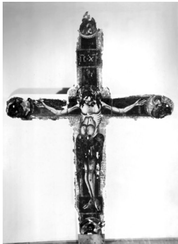
4. Raspelo tijekom zahvata 1959. godine Crucifix during the 1959 conservation

Obnovom rada Konzervatorskog zavoda za Dalmaciju 1945. godine omogućio je postupnu realizaciju svojega nauma, najavljenog u dopisu Ministarstvu prosvjete 23. lipnja iste godine – netom prije osnutka Zavoda: „Taj folklor je u našoj Oblasti bogat i raznolik, a mi mu baš na ovoj obali koju je tuđin uvijek priključivao tuđoj kulturnoj sferi moramo dati osobito značenje, jer baš to narodno blago, nošnja, melodije i igre potvrđuju slavensku kulturu naše Oblasti.“ 34 Prije njegova aktivnog angažmana, djelatnost – kako ih je često nazivao – „domaćih umjetnika“ na Jadranu nije bila dovoljno poznata, pa prema tome nije bilo uočeno ni njihovo značenje u kulturnoj afirmaciji dalmatinske umjetnosti na Jadranu. 35 Osnovni uspjesi u rješavanju te specifične povijesno-umjetničke problematike, od 1945. godine nadalje, sastojali su se upravo u obrađivanju umjetničkog stvaranja