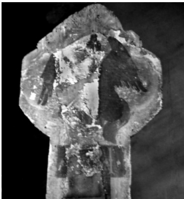
10. Detalj raspela snimljen u ožujku 1959. godine prije zahvata Detail of the crucifix from 1959, before conservation