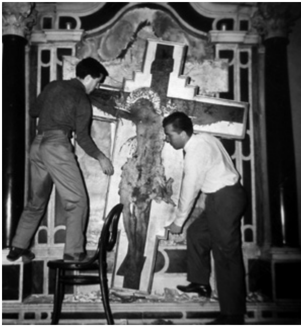
12. Demontiranje raspela Blaža Jurjeva Trogirana u crkvi sv. Franje u Splitu (fototeka AKO-ST, inv. br. 13697, broj negativna: R 6350, snimio I. M. 20. svibnja 1963.) Disassembly of the crucifix by Blaž, son of Juraj of Trogir, in the Church of St. Francis in Split (Photographs of the Conservation Department for Dalmatia, inv. no. 13697, negative number R 6350, I. M. 20 th May 1963)