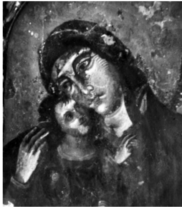
7. Slika tijekom zahvata (AKO-ST-ARR, mapa s fotografijama, bez oznake) Painting during conservation (Ministry of Culture of the Republic of Croatia, Conservation Department Archives, Archives of the Conservation Workshop, album of photographs, no tag)

koji način valorizirati povijesne i estetske vrijednosti umjetničkog djela dobila su međunarodni karakter. 46 Te su teme okupirale i Cvitu Fiskovića, pa je u dopisu iz 1958. godine, poslanom redakciji Vjesnika u Zagrebu, istaknuo: „Pri poslu konzerviranja treba uvijek uskladiti naučno proučavanje i ispitivanje objekta na kojem se vrši konzervatorski zahvat i način njegove zaštite i valoriziranja njegovog značenja.“ 47 Rješenje je vidio u organizaciji koja se temelji na zajedničkom radu povjesničara umjetnosti i restauratora komplementarnih znanja i vještina, koji imaju zajednički cilj i entuzijazam u analiziranju umjetničkih djela te uzajamnu odgovornost u konačnom restauriranju. 48 Upravo su zato važna njegova razmišljanja o restauriranim umjetninama, poput onih objavljenih u članku Riječ pri otvaranju izložbe restauriranih umjetnina u Splitu , objavljenom u časopisu Mogućnosti 1968. godine: „Popravljen i očišćen umjetnina je spašena od daljnjeg propadanja; ona više nije zabačena, već registrirana, a često i objavljena; preko nje je izložene, osvježene i osigurane pristup javnosti k majstorovu izrazu neposredniji; stručnjaci pak u njoj mogu jasnije uočiti odlike njegove ruke, znak njegove škole i vremena.“ 49