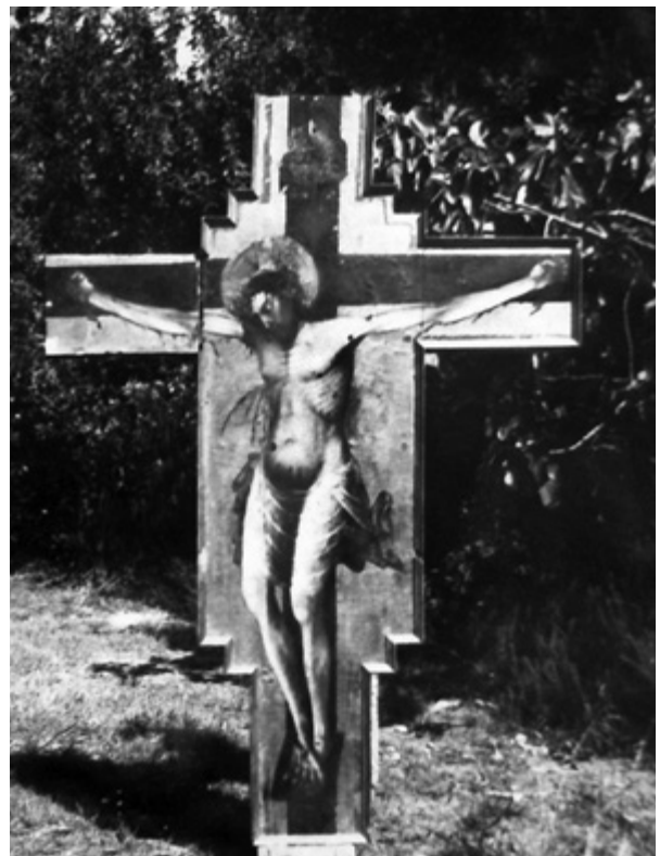
15. Raspelo tijekom čišćenja (fototeka AKO-ST, inv. br. 14713, broj negativna: R 7 (?) 26 – 8, snimio I. M. svibanj 1963.) Crucifix during cleaning (Photographs of the Conservation Department for Dalmatia, inv. no. 14713, negative number R 7 (?) 26 – 8, I. M. May 1963)