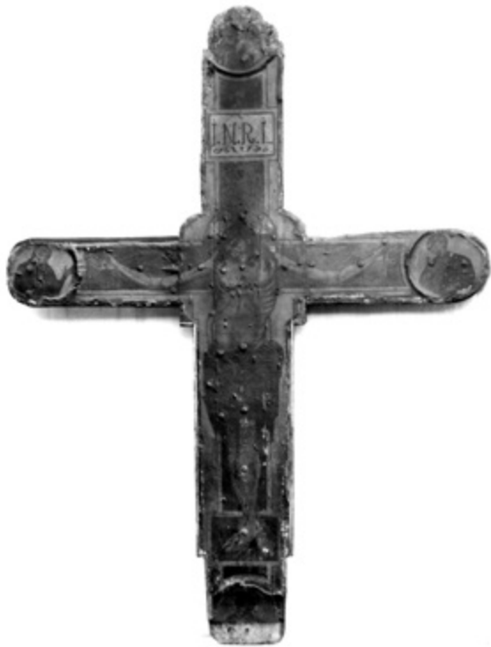
3. Naslikano raspelo iz samostana klarisa – zatečeno stanje 1958. godine Painted crucifix from the convent of Poor Clares, condition in 1958

razdoblja. 33 Posvjedočio je nepovoljnim uvjetima njihova smještaja u malim muzejima, crkvenim riznicama te gradskim i privatnim zbirka, što je dakako ubrzavalo već odavno započet proces degradacije krhkih materijala. U tim je umjetninama, kako sam piše, vidio „vjekove naše prošlosti“, a njihovu spašavanju posvetio je cijeli radni vijek.