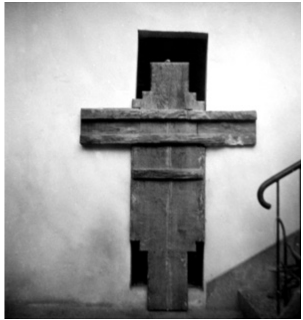
13. Raspelo snimljeno s poledine (fototeka AKO-ST, inv. br. 13700, broj negativna: R 6352-3, snimio I. M. 20. svibnja 1963.) Back of the crucifix (Photographs of the Conservation Department for Dalmatia, inv. no. 13700, negative number R 6352-3, I. M. 20 th May 1963)