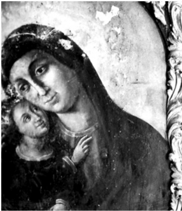
6. Bogorodica s Djetetom iz crkve sv. Stjepana na Sustipanu prije zahvata Madonna and Child from the Church of St. Stephen on Sustipan, before conservation