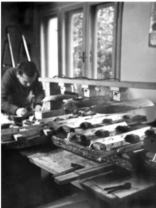
14. Raspelo tijekom impregniranja drva. Crucifix during wood impregnation