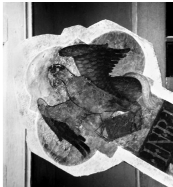
11. Raspelo, detalj nakon zahvata (fototeka AKO-ST, inv. br. 9033, broj negativna: R 2740, snimljeno u prosincu 1959.) Detail of the crucifix after conservation (Photographs of the Conservation Department for Dalmatia, inv. no. 9033, negative number R 2740, dated December 1959)