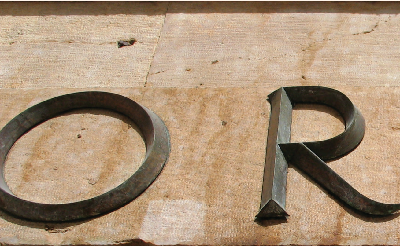
Fotografija dolje: Isti detalj nakon laserskog čišćenja.