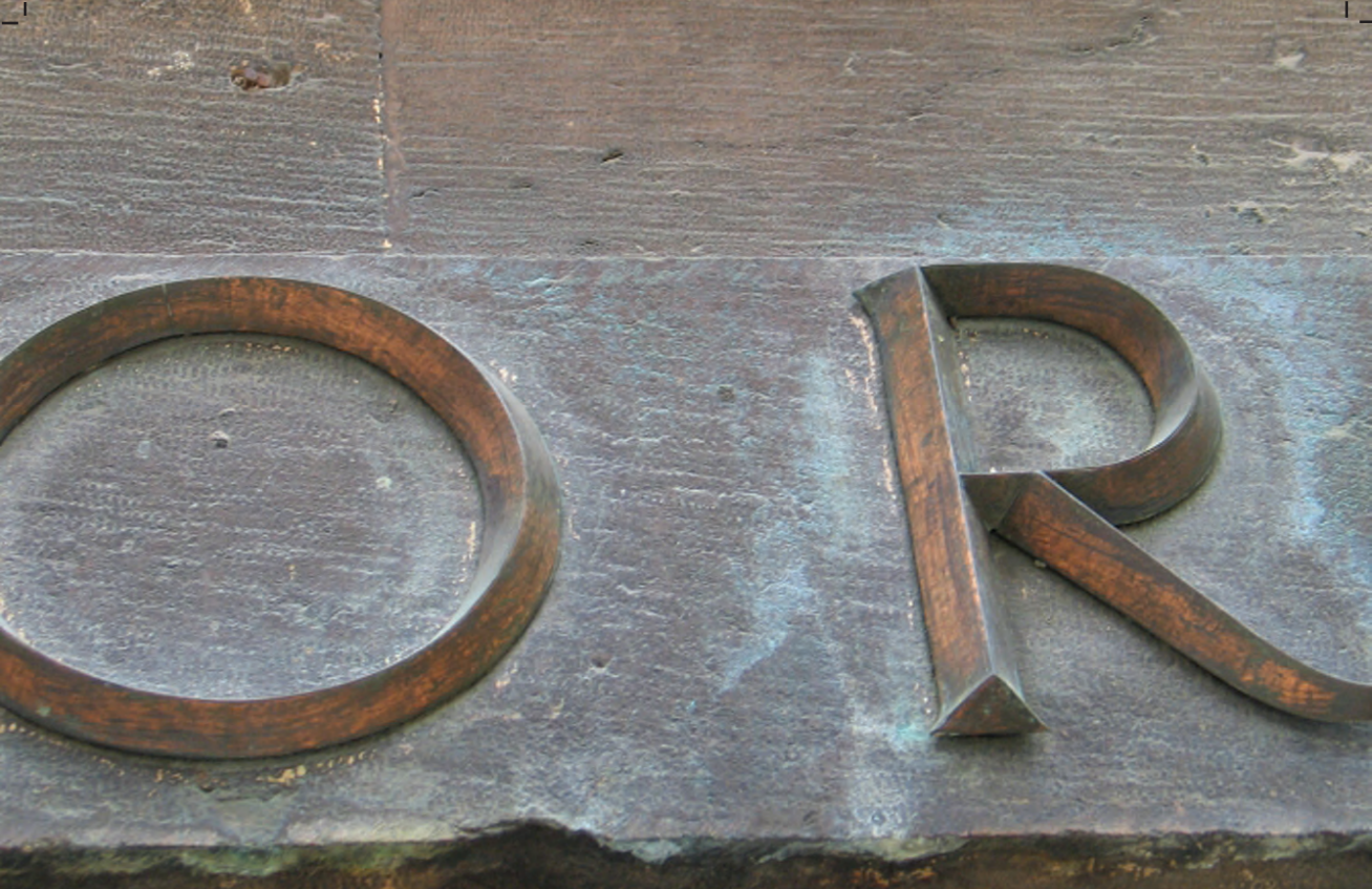
Fotografija gore: Detalj nadvratnika portala u prizemlju palače GrisogonoCipci, stanje prije zahvata.