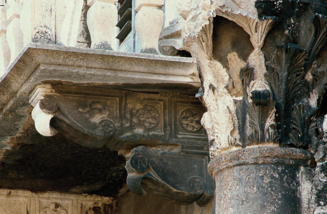
Na fotografiji: Detalj pročelja palače Skočibučić-Lukaris, stanje prije konzervatorsko-restauratorskog zahvata.

Druga faza radova, koja se odvijala u 2006. i 2007. godini, obuhvatila je pročelje palače Skočibučić-Lukaris u jugozapadnom uglu Peristila. U tom će se značajnom graditeljskom sklopu, koji osim antičke kolonade obuhvaćene njegovim istočnim pročeljem sadrži romaničke, gotičke, renesansne i barokne dijelove, urediti novi Muzej crkvene umjetnosti u kojem će se dostojno izložiti dragocjena djela iz riznice splitske katedrale i drugih crkava splitsko-makarske nadbiskupije.