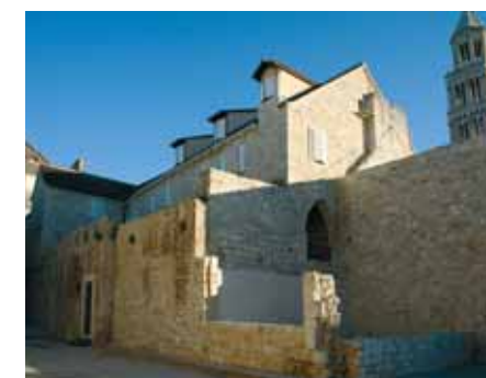
Etnografski muzej Split

Pomorski i povijesni muzej Hrvatskoga primorja u Rijeci osnovan je 28. lipnja 1961. s postavom u nekadašnjoj Guvernerovoj palači izgrađenoj 1896. godine prema projektu uglednoga mađarskog arhitekta Alajosa Hauszmanna. Kao rezidencija u parku neorenesansnoga stila Guvernerova je palača danas palača Muzeja koji prikuplja, čuva, obrađuje i prezentira predmete vezane uz povijest i kulturu Primorsko-goranske županije i grada Rijeke kao njezina središta od vremena prve naseljenosti u prapovijesti do 20. stoljeća. Bogati muzejski fundus čini grada Arheološkog, Etnografskog, Kulturnopovijesnog odjela te Odjela za povijest pomorstva, a sa svrhom očuvanja inventara reprezentativnog dijela Palače jedan je dio ambijentalno sačuvan. Zeleni, Crveni, Bijeli i Žuti salon te Mramorna dvorana i impozantni atrij otkrivaju arhitektonske vrijednosti Palače i odraz su kulture življenja viših društvenih slojeva na razmeđu stoljećā. Već više od četiri desetljeća Pomorski i povijesni muzej Hrvatskoga primorja svojim se stalnim postavom i mnogim vrijednim izložbama iz svog fundusa ili fundusa ostalih hrvatskih muzeja uključuje u obilježavanje značajnih događanja vezanih uz povijest i kulturu Rijeke, Primorsko-goranske županije i Hrvatske otkrivajući tako djeliće nedovoljno poznate prošlosti.